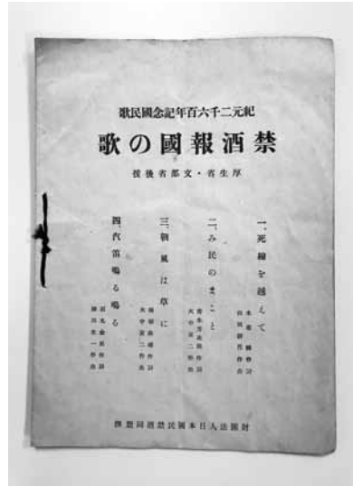
写真1 「禁酒報告の歌」 (1940年)

戦後、日本国民禁酒同盟は戦災によって解散状態にあったが、1949年、名前を財団法人日本禁酒同盟と改め禁酒運動を再開した。しかし、終戦直後の深刻な食糧難の時代においては、禁酒を求める声も強かったが、戦後復興が進むにつれ伝統的な禁酒運動は衰退し、路線を徐々に変えていくこととなった。経済の成長や醸造技術の発達によって酒類の生産が増加するにともない、アルコール依存症者が増え始めたのである。1953年には同盟内で断酒会が創立され、全国各地で断酒会が次々と設立されるようになっていく。