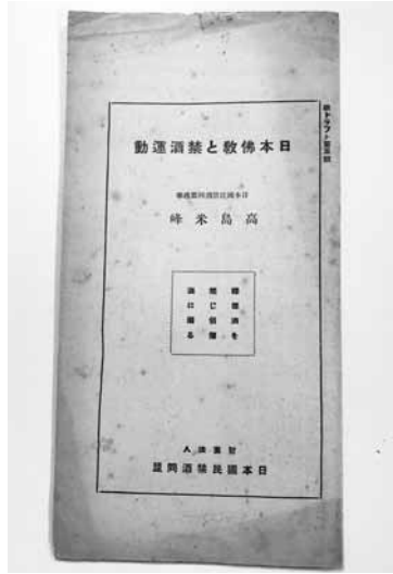
写真6 高嶋米峰『日本仏教徒と禁酒運動』日本国民禁酒同盟（年不詳）