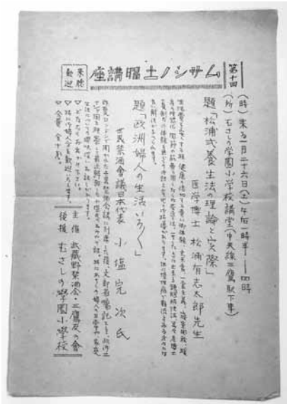
写真9 武蔵野禁酒会のチラシ (1935年)