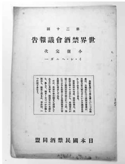
写真3 「第20回世界禁酒會議報告」 (1935年)

大阪の国民禁酒同盟と統合し設立された日本国民禁酒同盟は、1923年より雑誌のほか月に一度、新聞紙も発行した。最初の数年は新聞紙名が安定しなかった。しかし、1926年より『禁酒新聞』となり、1946年から1949年までの終戦後の一時期を除き、現在まで刊行されている。ただし、その間、1969年から1972年までは『酒なし新聞』、1972年から1974年までは『酒害予防新聞』と名前を変えている。寄贈資料には2010年までの『禁酒新聞』がある。