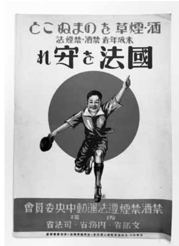
写真10 「国法を守れ」ポスター (年不詳)