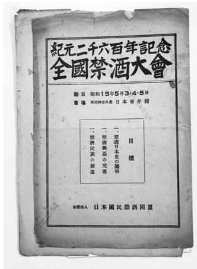
写真7 第21回全国禁酒大会のプログラム (1940年)