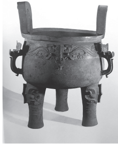
李学勤、松村道雄「中国美術大全集 4 工芸編青銅器1」一九九六年 株式会社京都書院