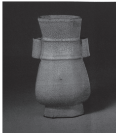
李学勤、松村道雄「中国美術大全集 2 工芸編陶磁2」一九九六年 株式会社京都書院