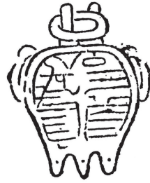
図2 上杉輝虎 印文不明 『書の日本史(第9巻) 古文書入門 花押・印章総覧・総索引』一九七 六年 平凡社

これらすべてで煮炊きの他に古代中国の祭器であるという共通点が存在する。もともと、印章は、花押の代わりに使用される以前、古代中国で封泥に使用されていたという点や、先でまとめた先行研究に続日本書紀に記述が見られただけの印をあげたが、これについて儀礼用であるという見方があるため、印の古来からの流れが祭器を模すといった行為になつた可能性はある。意匠が縄文土器を連想させるか否は、伊達政宗の印章が後期になるにつれ豪華になつていくのと同様、権威の主