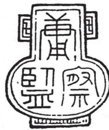
図2 朝倉義景 「庸察監」 『書の日本史(第9巻) 古文書入門 花押・印章総覧・総索引』一九七 六年 平凡社