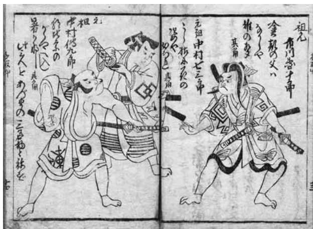
図D 国立国会図書館蔵『名取草』