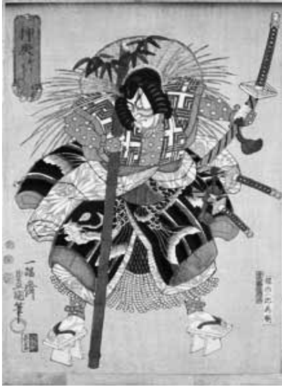
図E 国立国会図書館蔵「押戻」

見得をしている。また、現代の歌舞伎で「押戻」が出る舞台と言えば、『京鹿子娘道成寺』後半の大館左馬五郎が代表的な例であろうが、こちらは鬘においてもより和藤内の拵えに近い。押戻に為朝役が出ていた演目については、今は分らないものの、ここでもやはり、荒事芸の為朝の造型において、大竹を携えている点に、朝比奈と共通する要素が見出せるのである。