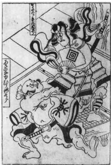
図C 『兵根元曾我』 絵入狂言本

は鶴の丸紋であると一般に誤って記憶されるようになったと指摘しているのである。加えて興味深いのは、「小林」という、『吾妻鏡』にも見える鎌倉幕府創始の地小