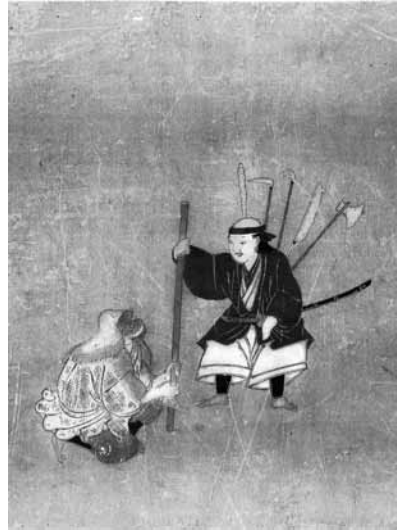
図A 国文学研究資料館蔵『狂言絵』 「イ十二・あさいな」(部分)

朝比奈に閻魔王が振り回されている場面であろうか。但しこの大竹は、二、三の竹の節も見え、朝比奈の背丈を越えるような長さではあるが、朝比奈役の役者の右手は握りしめているに見え、虎寛本や保教本のような太さのある大竹には見えない。杖竹とも大竹とも形容し得るような太さの竹である。