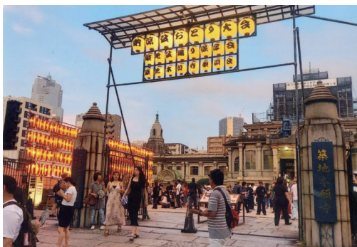
▼写真3 納涼盆踊り大会入口風景