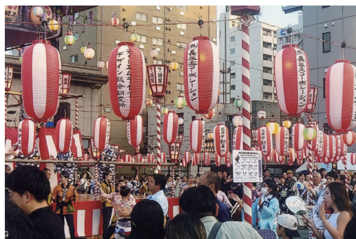
▼写真4 会場の中央付近の提灯