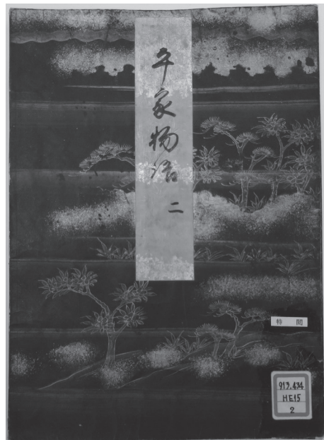
図2 『平家物語』巻2表紙

受贈者は不明であるが、第4代盛岡南部家当主南部重信(1616-1702)の母、慈徳院から寛永11(1634)年に賜ったとの奥書があり、出自の一端がうかがわれる。紺地金泥表紙をもつ美本である。