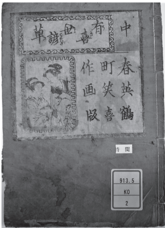
図6 恋川春町作；英笑画 『有喜世諺草 3巻』 鶴喜版, [出版年不 明]. 3冊. 巻中表紙. 武蔵野大学図書館所蔵