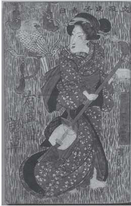
図5 十返舎一九 作、歌川国安 画 『有喜世諺草 2巻』鶴屋喜右 衛門, 文政11 [1828]. 1冊 < https://dl.ndl.go.jp/ info:ndljp/pid/10300970 > 国立国会図書館所蔵