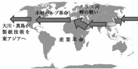
図1 製紙技術の伝播過程

ものに変質したことが特に重要だと思われる。その変質に焦点を当てて西回りルートを概観する。