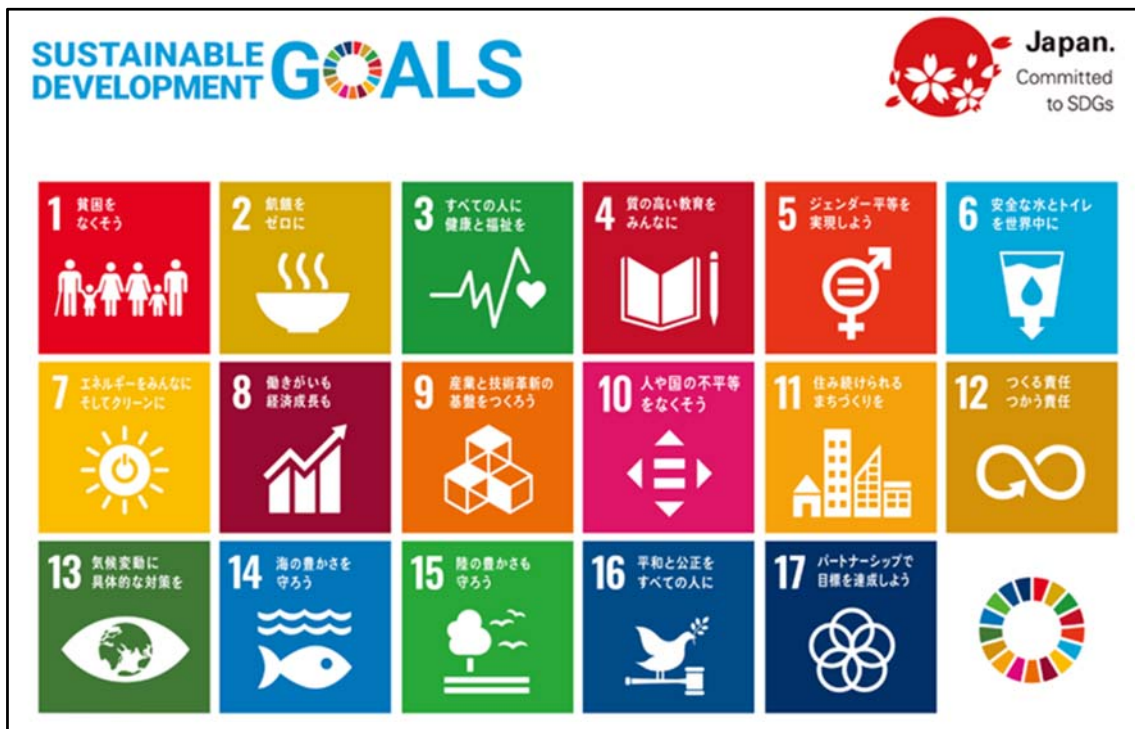
図1 SDGsにおける17のゴール（外務省）

実行宣言」が出され、SDGsが「いきとし生けるものが幸せになるために」という仏教の根源的な願いと軌を一にするものであり、SDGsの実行に向けてすべての学生と教職員を挙げて全力で邁進することが掲げられた。