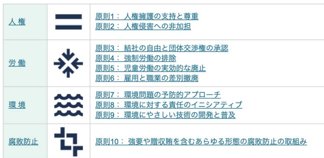
図7 国連グローバル・コンパクトの原則（GC10）

国連グローバル・コンパクトの原則（GC10）は10項目から構成される（図7）。GC10が依拠しているのは、「世界人権宣言」（1948）、「環境と開発に関するリオ宣言」（1992）、「労働における基本的原則および権利に関するILO宣言」（1998）、および「腐敗防止に関する国連条約」（2003）である。