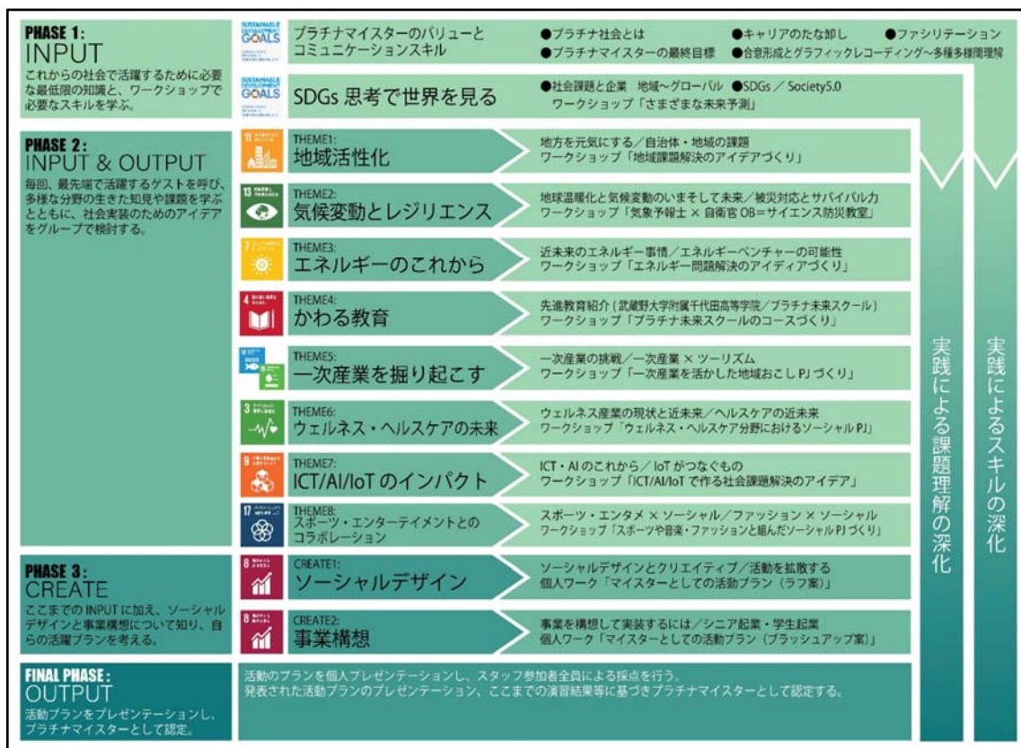
図 3 教育学研究科「国際教育研究 1」（2019 年度）

ために必要な知識及び技能の習得に関して、新入生生徒全員に円形の SDGs バッジを付与するとともに、新入生オリエンテーションでは、SDGs カードゲームや SDGs の 17 のゴールに関連する実践的活動を、教育交流協定を結ぶ東京都立八丈高等学校（2018 年度）および札幌新陽高等学校（2019 年度）の生徒とともに行った。また、武蔵野大学大学院教育学研究科の授業「国際教育研究 1」（図 3）は、プラチナマイスターアカデミーとの共催で実施し、SDGs に関連する内容で構成したが、武蔵野大学附属千代田高等学院内のアカデミック・リソース・センターで行われる授業は、高校生も参加可能な形の公開講座とし、生徒は興味関心に応じて大学院授業を聴講し、SDGs に関する知見を深めていった。