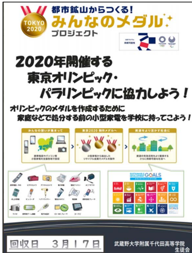
図5 「都市鉱山からつくる！みんなのメダルプロジェクト」ポスター

武蔵野大学附属千代田高等学院の生徒会は、「都市鉱山からつくる！みんなのメダルプロジェクト」とし、ポスター（図5）と小型金属の回収バッグを製作し、校内および学校近隣のマンション等へのポスターの掲示と回収バッグの配布を行った。同プロジェクトで回収された貴金属類の内訳は図6の通りである。