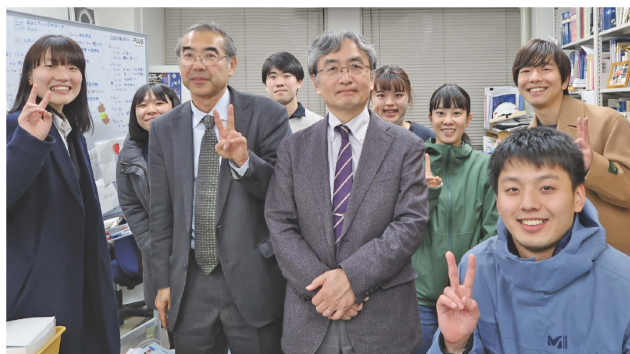
宇宙教育セミナーを終えて(宇宙地球科学教育研究室)

世界の幸せをカタチにする。 Creating Peace & Happiness for the World