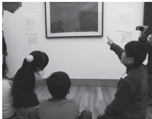
友達と話し合いながらタイトルを考える。

その後、実践事例3に関連して、スケッチばかりでなくワークシートに作者の日記を書いたり、俳句を作ったりするような言葉による表現活動も行なっている。実践事例4に関しては、ほとんどの一般参観者は初めて見る取り組みであったため、多くの参観者は興味を持ってこの活動をみていた。しかし一部の参観者からは、このような活動は、美術館内の活動としては不謹慎であるというような苦情を寄せられることもあった。今後の課題である。