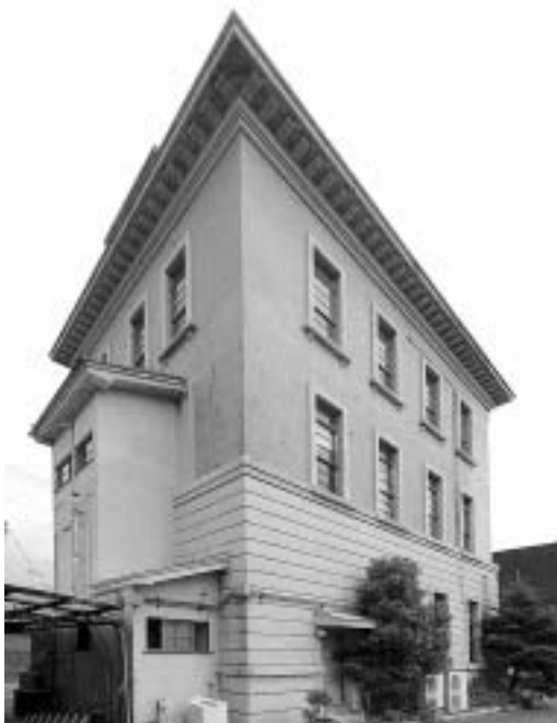
図7：南西から見た旧西本組本社ビル