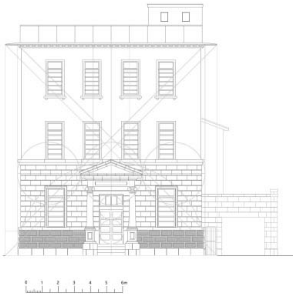
図9：北側正面図の構成分析図