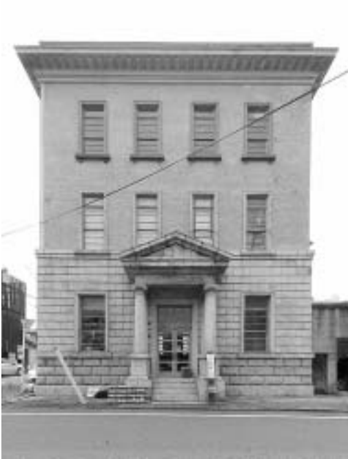
図 1：旧西本組本社ビル北側正面