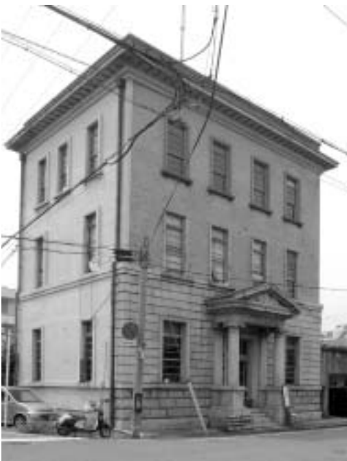
図 3：北東から見た旧西本組本社ビル