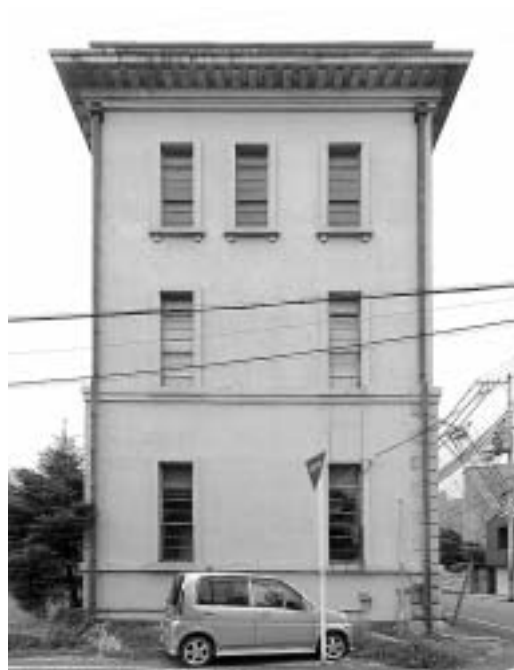
図 4：旧西本組本社ビル東面