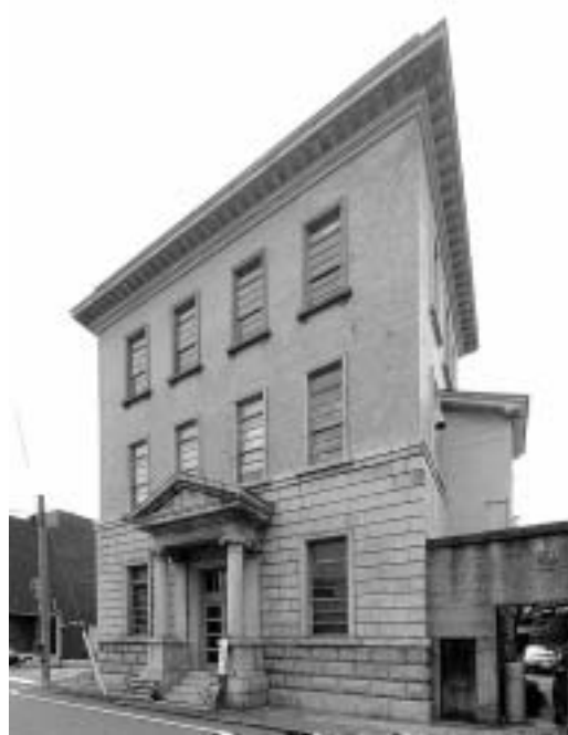
図 2：西北から見た旧西本組本社ビル