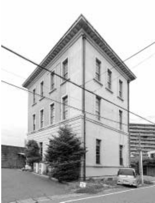
図5：南東から見た旧西本組本社ビル