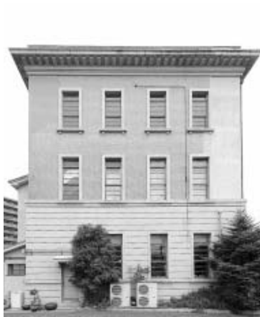
図6：旧西本組本社ビル南面