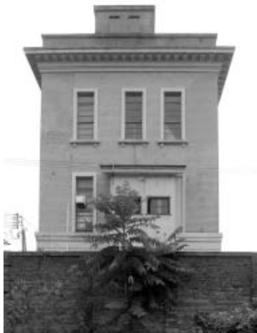
図8：旧西本組本社ビル西面