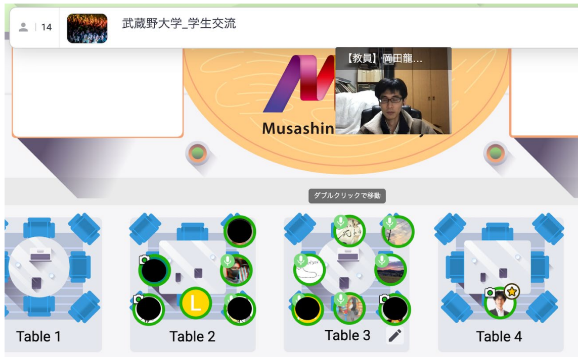
図2 「夜ふかし Remo 会」の一場面(一部プライバシー保護のため修正).

図2は夜ふかし Remo 会の一場面である。2つのテーブルに分かれて参加者が集まり、それぞれが会話している様子が見て取れる。